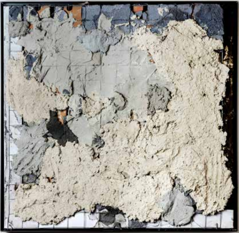
Robin Mullery Topography Series