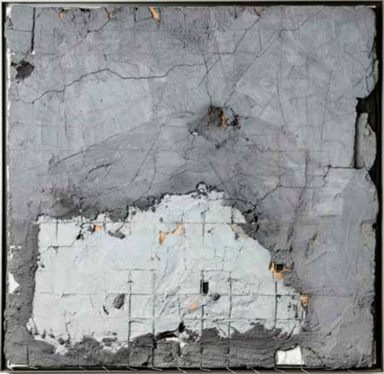
Robin Mullery Topography Series