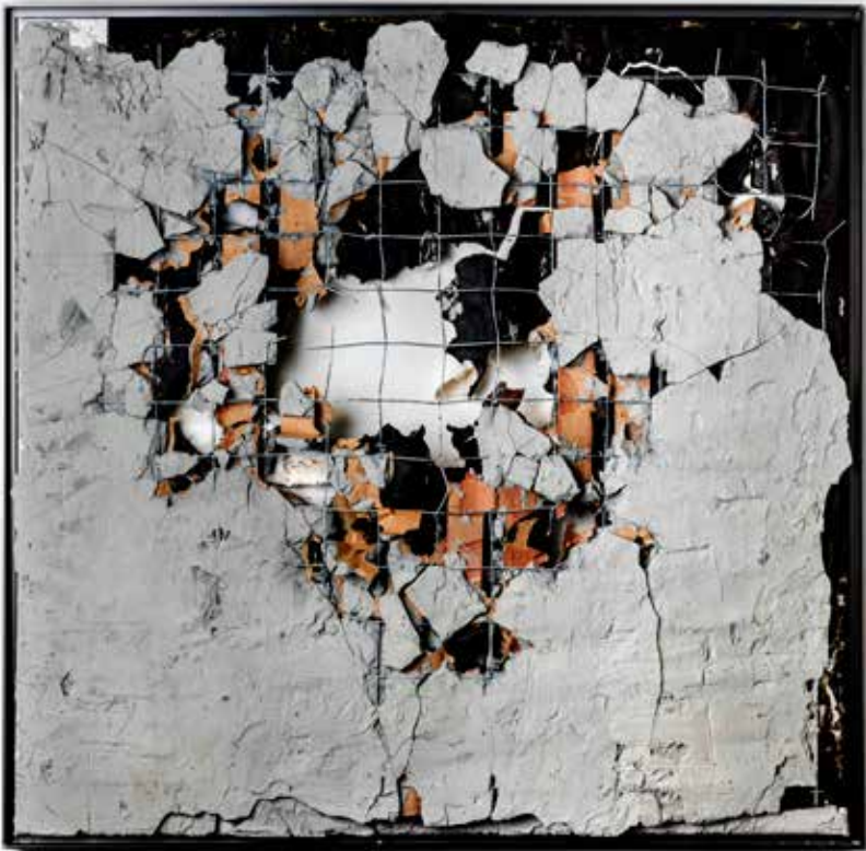
Robin Mullery Topography Series