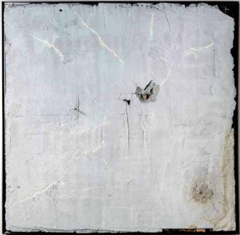
Robin Mullery Topography Series