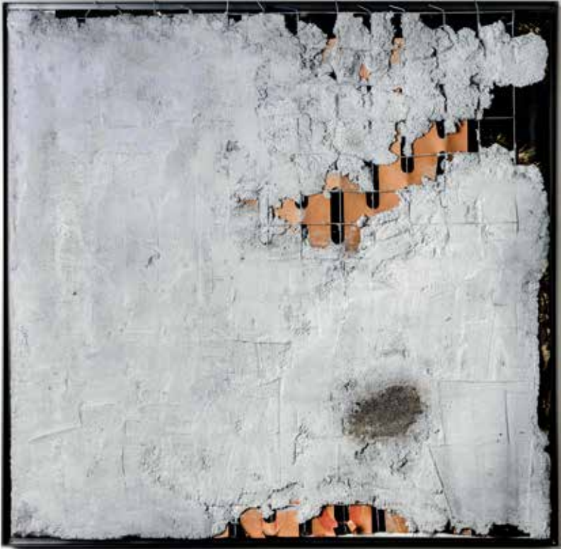
Robin Mullery Topography Series